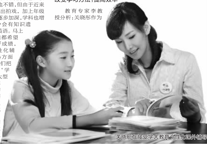
关晓彤在接受学大教育个性化课外辅导

据悉,学大教育近期将面向全社会推出集权威性、专业性、全面性之最佳的全学科在线测评系统,免费为广大学生提供个性化学科测评诊断,让更多学生更准确地认识到自身的学习状况,进一步感受个性化教育带来的无限魅力。