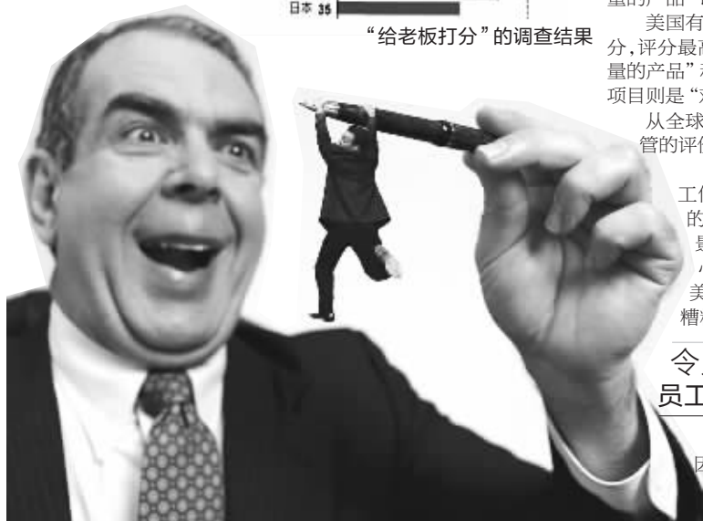
老板和员工,天生就是一对冤家

2011年第1期的《深圳青年·上半月》,就列出了许多正在把我们变傻的事物,不妨看看,你已经傻到什么程度了。 新阅读推荐