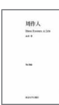
余斌著 《周作人》 南京大学出版社 2010年10月

南大余斌教授的《周作人》, 在周氏传记里, 是字数最少的。像周作人这样的大家, 写得多往往比写得少容易, 懂得舍弃无疑是这本传记最大的好处。但简洁并不意味着简陋, 特别是在剖析传主复杂性时论及的某几点新观点, 虽点到即止但细究之下也有不少值得回味的地方。