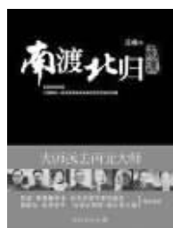
2011年1月 湖南文艺出版社 《南渡北归》

这本书是张辛欣淡出国内文坛多年后, 倾十年之力, 创作的最新长篇小说力作。小说以第一人称视角, 以个人成长为线索, 写出了一代人的青春激情、成长历史。书中展现了作者“集中国大历史线索与个人传奇于一身”的个人经历。