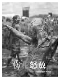
2010年12月 甘肃人民美术出版社 郝静著 《伤花怒放》

近500幅稀缺席历史图片, 规模宏大, 材料丰富, 从摇滚与革命、摇滚与极权、摇滚与高雅、摇滚与民族、摇滚与秩序、摇滚与性、摇滚与宗教、摇滚与毒品几个方面讲述了摇滚在发展历程上的被缚与抗争。