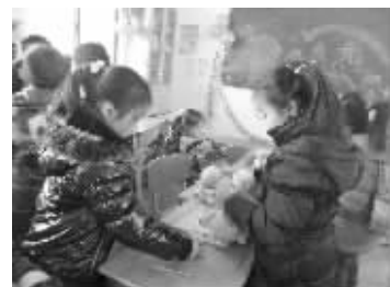
淘东西也是锻炼商业头脑