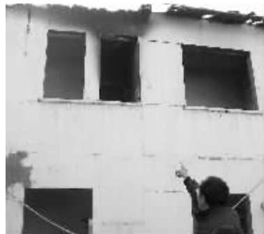
失火的空置房