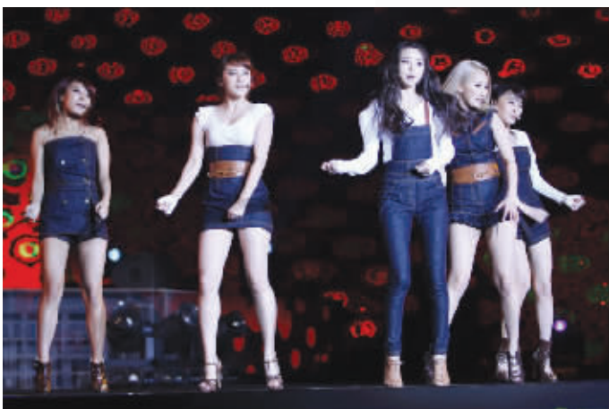
wonder girls江苏跨年献上劲歌热舞

昨晚对于电视观众来说绝对是又纠结又高兴的一晚,江苏卫视、湖南卫视、央视、安徽卫视等十几家精心准备的跨年演唱会在昨晚7:30后陆续播出,让观众眼花缭乱,不知到底该让遥控器停留在哪个频道上。当然,有观众喜欢听“神曲”,也有观众想看“大腕”;有人喜欢看“喜剧”,有人喜欢看“颁奖”。而对比这些跨年晚会,各台各有特点,不管观众看神马,基本没有“浮云”闪现。