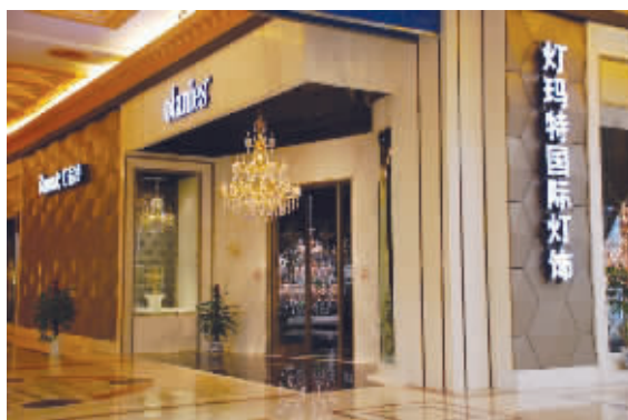
灯玛特实体店 灯玛特全方位专业服务

在灯饰行业,灯玛特是当之无愧的先锋:首创“1+N”连锁运营模式、首推“明码实价、深度服务”的经营方式、成立了全国首家“光环境设计师俱乐部”,引入“生态健康光”设计理念,率先通过中国商务部备案的跨省灯饰连锁运营商。16年来,灯玛特为32万个家庭提供了“灯饰销售、方案设计、个性定制、配送安装、维护保养”的全方位专业服务。