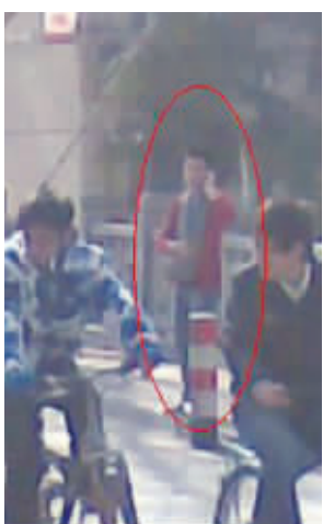
发帖人称,圈出的红衣男子就是车主(请图片作者来认领稿费)

东南大学和南京航空航天大学保卫处的老师则表示,学校并没有专门针对学生私家车的管理方法。