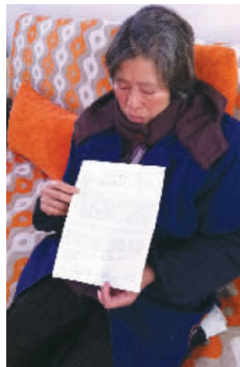
孙女士的婆婆展示媳妇的病历