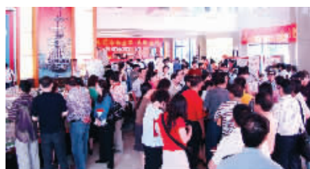
岁末少量保留房源上市