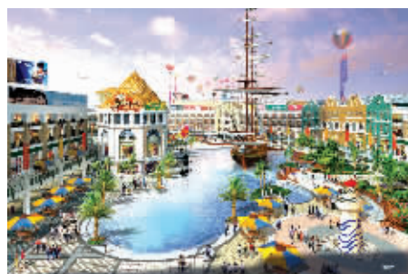
项目位于南部新城核心

明发商业广场购物、餐饮、娱乐、休闲、酒店、旅游、游乐激荡共生,26000㎡百货主力店,逾18000㎡大型超市,18000㎡五星级酒店,近15000㎡精品家居,8500㎡华东最大奢华夜总会,8000㎡主力酒楼,7000㎡品牌电器,6000㎡中影东方……全方位共振!现正推出的30-60㎡TOP国际时尚中心沿街旺铺旺铺,为整个项目最聚集人气的区域,东靠站东路,南接欧罗巴风情广场,西临大型百货主力店,北邻丁墙路,最大限度临街互动,人流、商流强势际会!岁末少量保留房源压轴巨献,财富狂潮最后一波,商铺投资最后一搏。