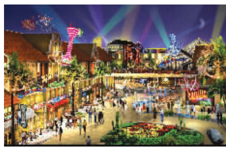
吸金魅力匹敌新街口