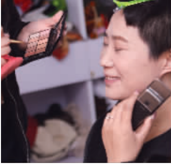
化妆时不忘办公,有点小忙

眼光,能够挖掘出拍摄对象自己都没能察觉的另一面,就如同一个好的导演能让演员表现出各个不同的层面一样。”从事新闻行业的人,平日表现出来的更多的是严肃的一面,看似与时尚毫不接轨。然而,刘方视觉却能以其敏锐的艺术眼光,挖掘出这个团队中每一位成员柔情和时尚的一面。并将这一面放大在镜头之下,演绎得淋漓尽致。