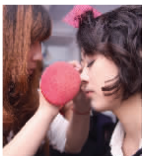
为打理出漂亮睫毛,我忍……