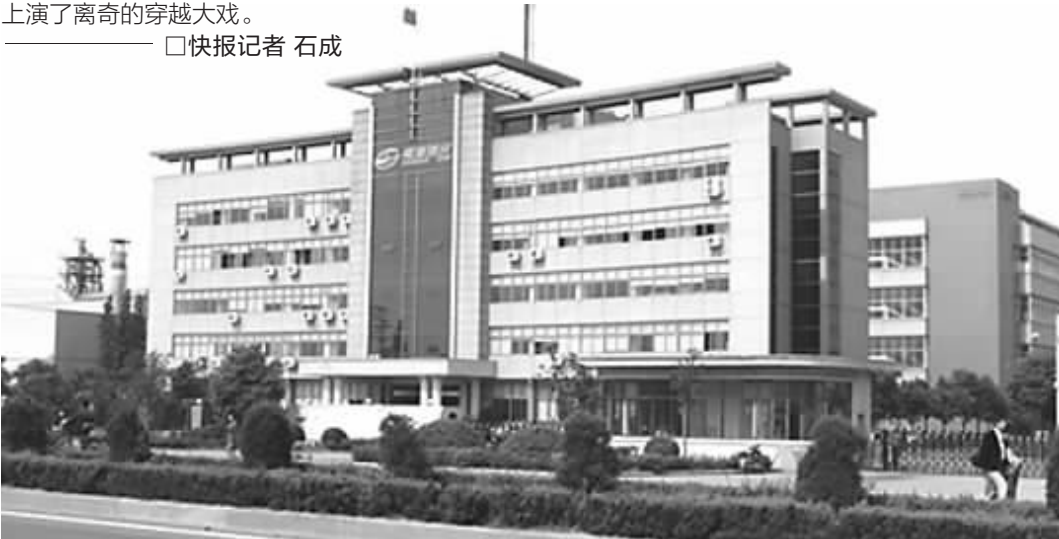
江苏长海复合材料股份有限公司 据其网站

2010年3月1日,江苏省国资委出具批复,确认江苏高晋所持江苏长海的股份不再认定为国有股。