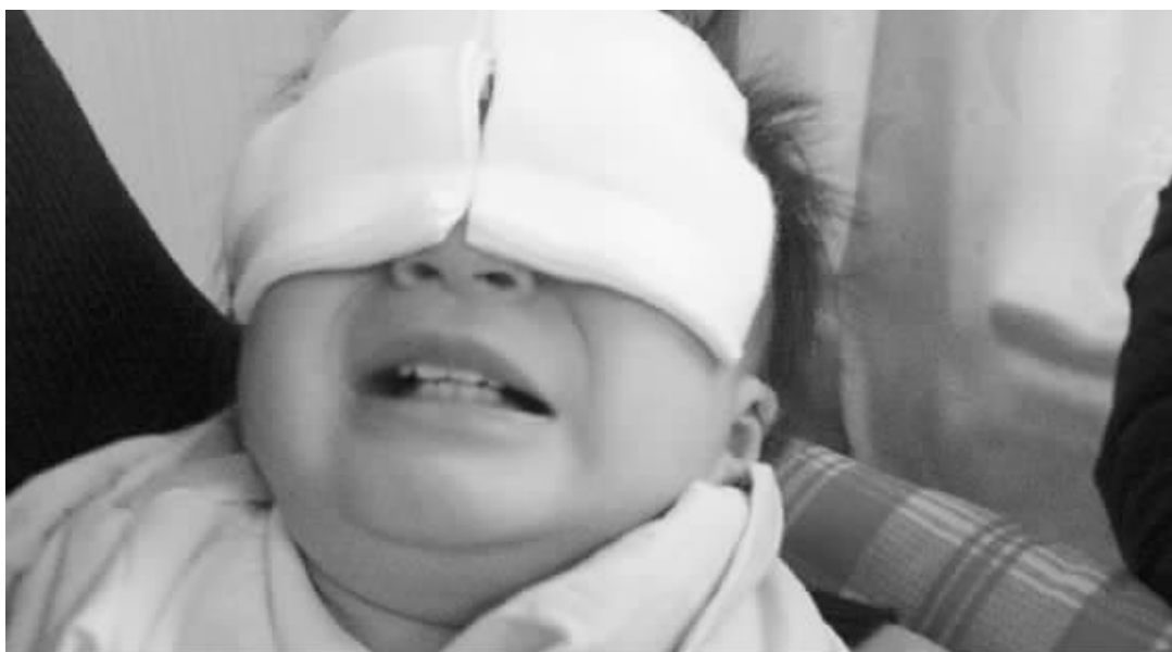
手术后,女童的双眼都被蒙上了纱布