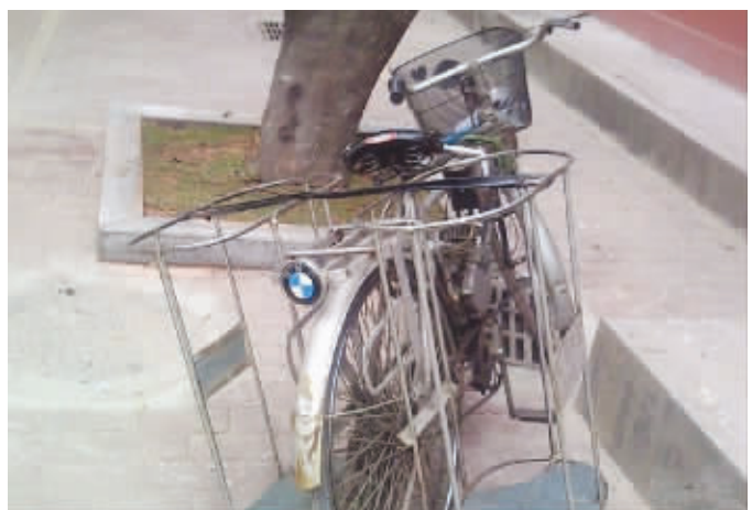
动力足、容量大,名车就是名车