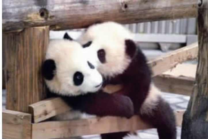
别,我们是国宝,你这样太失礼了