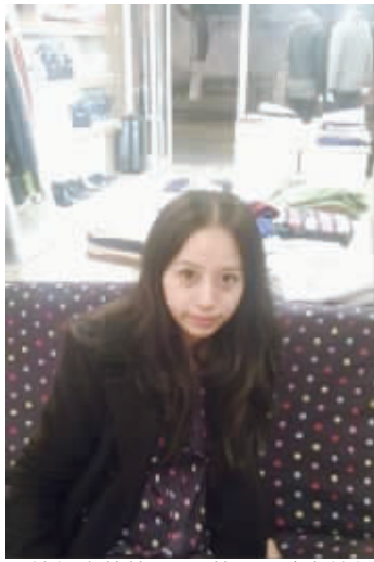
撞衫也就算了,居然跟一沙发撞衫