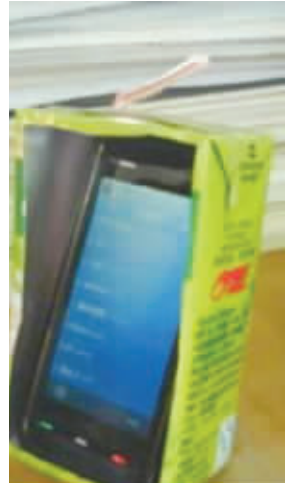
上课玩iPhone的最高境界