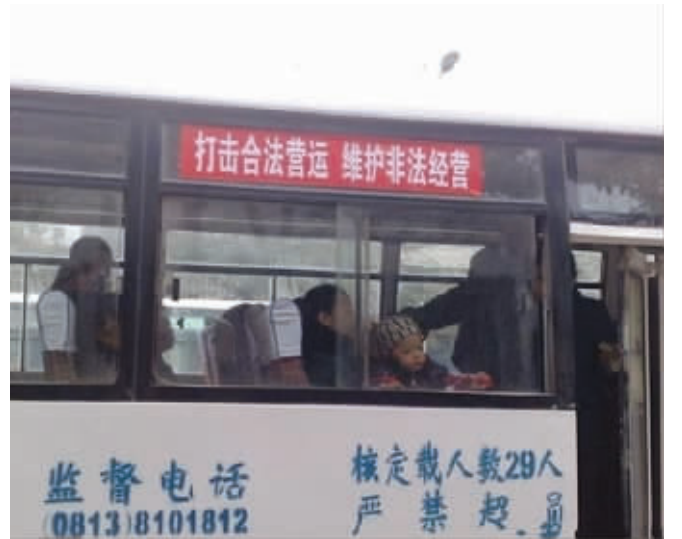
这让人都不知道该支持谁