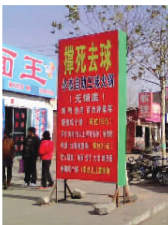
吃自助餐需要的就是这股霸气