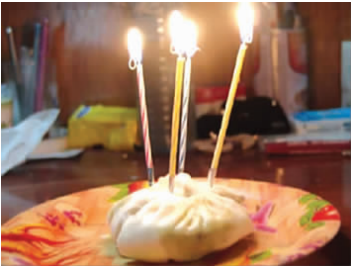
今天我家狗狗4岁生日