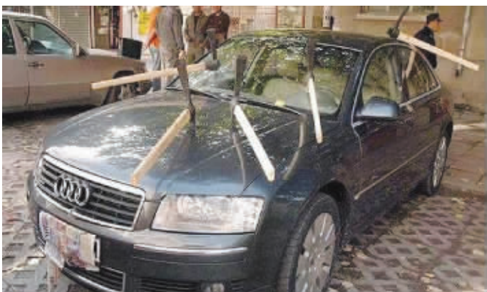
我们来了我们走了,不带走一把斧头