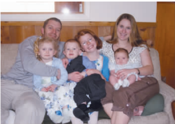
底下那位男子,你为何在那里?