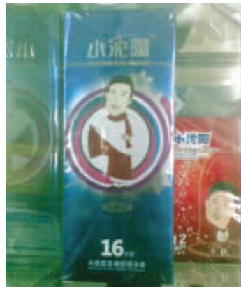
人出名了,什么都会往你身上套