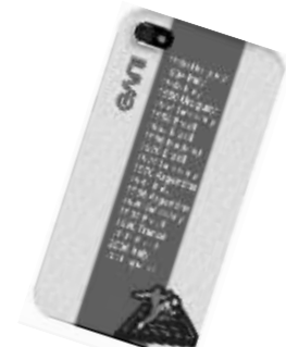
世界杯主题iPhone4外壳, 球迷首选