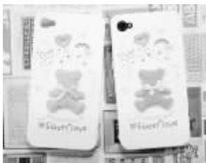
甜美系外壳, 小熊是立体的