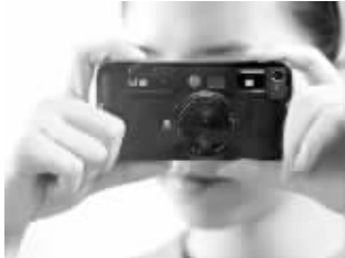
这是数码相机吗? 这还是iPhone4加了一个创意外壳