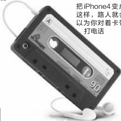
把iPhone4变成这样, 路人就会以为你带着卡带打电话