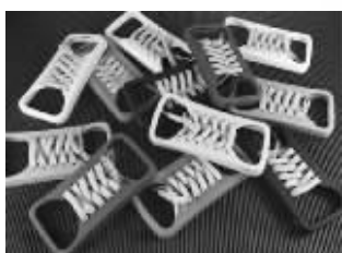
你也可以把iPhone4变成帆布鞋