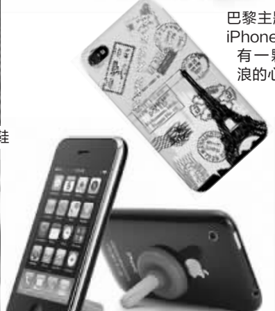
巴黎主题的iPhone4, 有一颗流浪的心