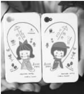
情侣iPhone4外壳, 可以拼成完整的一幅画