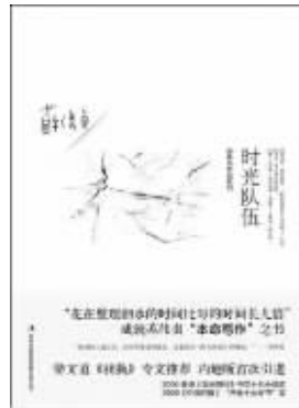
吉林出版集团 2010年11月 【吉】苏伟贞著 《时光队伍》

万物唯一不可更改的定律:由生向死。而所有生命,所有的物种,在出生向死的道路上,都有一个共同的指向:即耗散一切能量,要尽一切花样,要存活,向生。细菌、病原、苔藓、灌木、草履虫、恐龙、人类。而关于生存和记载自己生存的手段,要算人类花样最多。