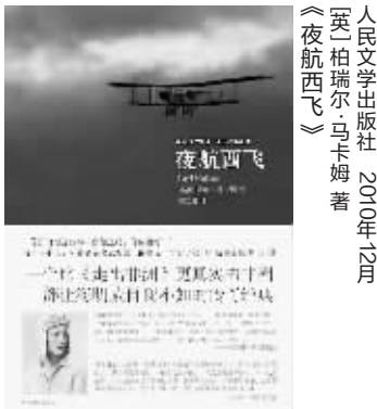
人民文学出版社 2010年12月 【英】柏瑞尔·马卡姆著 《夜航西飞》

1936年9月,柏瑞尔·马卡姆驾驶飞机从英国出发,一路向西飞行,最后在加拿大迫降,费时21小时25分。在随后的记者见面会上,人们注视着脱下飞行帽与墨镜的她,看到一副极清秀优雅的面容,马卡姆由此成了传奇。要知道,一个同时拥有辉煌履历和美丽容颜的女性,在那样一个男权主义千年不衰而女权主义又正当青春的时代,是最不吃力却又十分讨好的。但马卡姆却在出版了详述她非洲生活经历的回忆录《夜航西飞》短短几年后,便一声不响地跑回她的非洲“老家”肯尼亚驯马去了。于是,《夜航西飞》就像是对所有在喧嚣中关注她的人一个交代,书写完了,她便觉得她要说的都已说完。