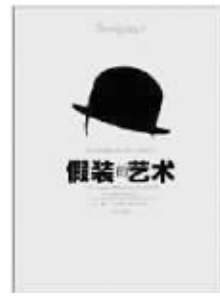
南方出版社 2010年11月 【美】怀特德·弗莱著 《假装的艺术》

作者教你在阅读、电影、古典音乐、建筑、美酒等常用时尚话题中自由穿梭。本书写作的初衷是为讽刺一些爱面子的假象人,但是其渊博的知识与幽默的写作风格却使本书迅速流行,反而成了“假装派”人手一册的谈资手册。