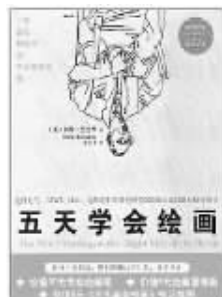
北方文艺出版社 2010年10月 【美】贝蒂·文德华著 《五天学会绘画》

作者试图用五天教会绘画的方式启发人们积极开发自己的右脑——在传统教育系统中被忽视的创造力大脑。通过五天对边线、空间、相互关系、光影等这些绘画基本技巧的掌握,获得一种新的视角,也就是像艺术家一样看事物,它不仅是一本讲绘画的书,更是一本讲生存的书。