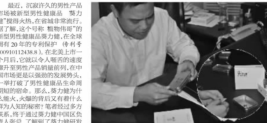
植物伟哥 你吃了吗? 首次特大买赠进行中……

最近,沉寂许久的男性产品市场被新型男性保健品“葵力健”搅得火热,在省城非常流行。据了解,这个号称“植物伟哥”的新型男性保健品葵力健,在全球拥有20年的专利保护(专利号200910112438.8)。在北美上市一个月后,它就以令人咋舌的速度飙升至男性产品销量前列,在中国市场更是以强劲的发展势头,一举打破了男性保健品生命周期短的宿命。那么,葵力健为什么能火,火爆的背后又有着什么不为人知的秘密?笔者经过多方联系,终于通过葵力健中国区负责人张总,了解到葵力健研发的背景,知道了葵力健受人推崇的真正原因。