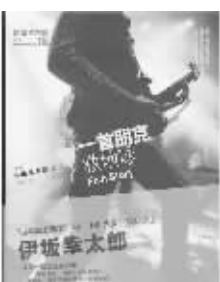
译林出版社 2010年12月 【日】伊折幸太郎著 《一首朋克救地球》

一支朋克乐队生不逢时,唱片销量不佳。四名乐队成员怀着复杂的心情录制完他们最后一首作品《一首朋克救地球》,可是没有交集的人们受到这一首歌的感召联系起来,演绎各自各自的英雄故事。