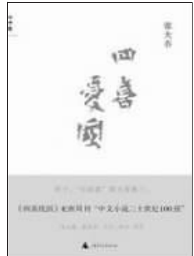
张大成著 2010年10月版 《四喜忧国》

台湾作家张大春的小说《四喜忧国》,在二十世纪华语文学百强排行榜中排第九十位。《四喜忧国》的主人公朱四喜,是一个国共内战期间渡海来台的外省人。他几近目不识丁,却对报纸上的官方文告恭恭敬敬。对于长期生活在威权体制之下的朱四喜来说,文告上的每一个字无不是天字律令,具有至高无上的神圣性。文告是导师的话语,是道德的路标,似乎对于芸芸众生来说是时刻不可或缺。