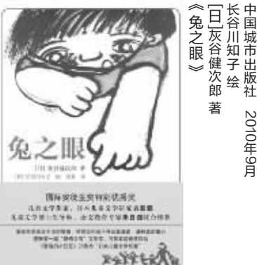
中国城市出版社 2010年9月 【日】张大成著 《兔之眼》

与经典童书《窗边的小豆豆》相似,《兔之眼》既是一部童书,同时,又是一部写给成人阅读的童书。作为一部小说,《兔之眼》讲述的故事当然并不复杂,一个刚刚大学毕业即走上教育行业的美女老师小谷英美,一个行为另类,教学方法独特,却不太讨成人喜欢的“痞子教师”立足;一个孤僻沉默,成绩奇差,偶尔发怒就会咬人,却喜欢收集各种生活“问题儿童”白井耕三;一个无法自理,常常撕坏别人作业本的智障儿童美奈子……一个个既温暖,又充满诗意的故事,围绕这些看似寻常的人物逐一展开。诸如,为了接近铁三,小谷老师主动与苍蝇共舞;为了争取孩子们的权益,立足老师的绝食抗议;另外,还有救助被捉走的小狗阿吉,以及师生