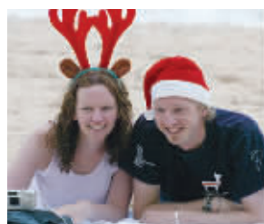
2004年12月25日圣诞节,一对英国情侣在悉尼曼利海滩度蜜月。