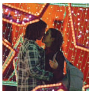
2005年12月13日,一对情侣在葡萄牙的圣诞彩灯旁拥吻。

张是两只猪样子的储蓄罐,攒钱买房子,有一张是在顶楼看夜景,还有一张你接着我甜甜地睡着了,你还会翻到一张我草拟的“结婚宣言”,等着你签字……翻到最后,不再是彩色铅笔、水彩笔的画,而是一张灰色的素描;年老的我们,爱情再也不会那么绚烂了,我变瘦了,你变胖了,可我们依然伴着月光,静静地共枕眠。当然,还有一枚求婚戒指。牙牙,降温的圣诞、恋爱的绘本、六年的承诺,我是多么希望烟火升起的一刹那,你的头能点下。这个圣诞,让我们将爱情进行到底。