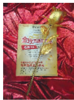
金箔玫瑰和“求爱指南”

每到圣诞节,象征爱情的玫瑰价格总要大涨,但终究会凋零,而宝庆银楼新街口商品城的金箔玫瑰则是用金箔打造的,颜色鲜艳,并且永不凋谢,这正寓意着情感亘古不变。圣诞节,宝庆银楼新街口商品城也推出了很多优惠活动,如珠宝、玉器、K金、银饰每10元积1分;黄金每50元积1分,生日当天双倍积分;此外商品城三楼“饰品养护中心”提供免费验金、来宝加工、首饰出新、工艺装饰、珠宝首饰维修服务。