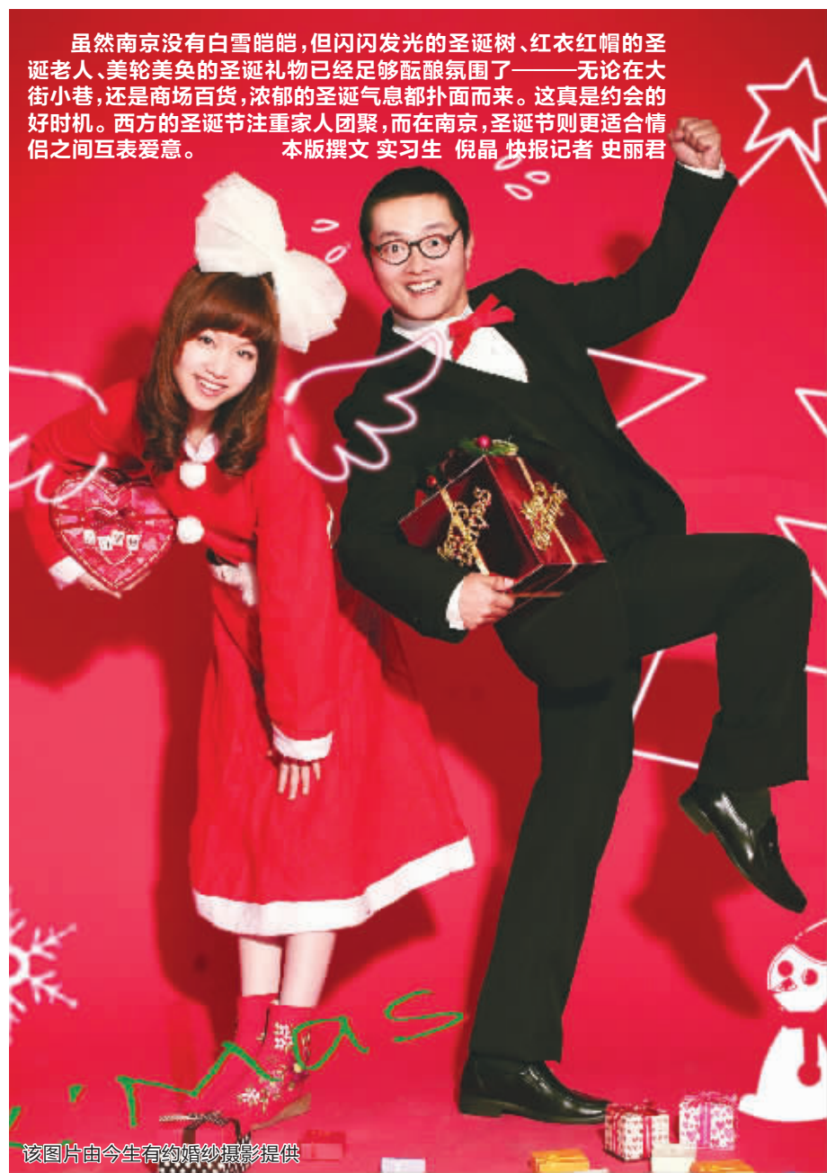
虽然南京没有白雪皑皑,但闪闪发光的圣诞树、红衣服、圣诞老人、美轮美奂的圣诞礼物已经足够酝酿氛围了——无论在大街小巷,还是商场百货,浓郁的圣诞气息都扑面而来。这真是约会的好时机。西方的圣诞节注重家人团聚,而在南京,圣诞节则更适合情侣之间互表爱意。本版撰文 实习生 倪晶 快报记者 史丽君