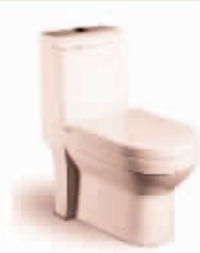
全自动冲洗座便器