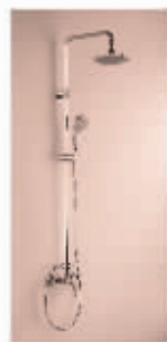
热带雨林高档花洒