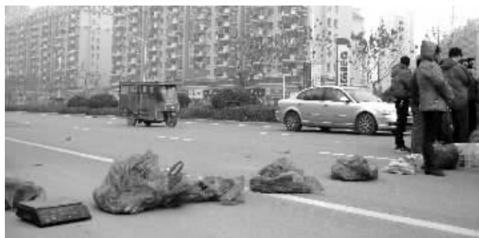
快车道上卖菜, 交通很受影响

虽然菜场里的摊主都已经缴纳了一年的摊位费和保证金, 但菜场老板表示, 露天菜场什么时候被取缔, 合同就从哪天算起, 现在免费给他们摆摊。