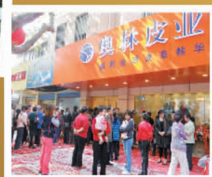
奥林太平南路店 两天热销80万 创造家居皮革销售神话