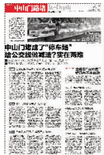
12月16日快报相关报道