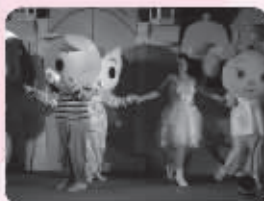
● 新年Party,东方爱婴的卡通形象和宝宝们一起演出