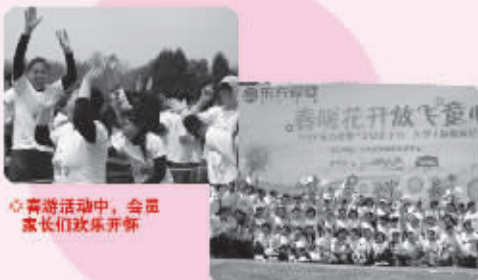
● 春游活动中,会员家长们欢乐开怀