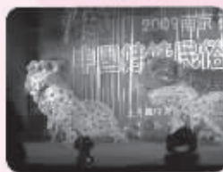
● 民俗新年聚会现场:真人舞狮,热闹喜庆