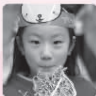
● 民俗新年聚会,让宝宝亲身了解我们的民族文化