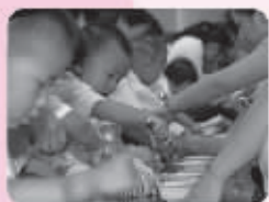
● 大赛现场,紧张而热烈,宝贝们,加油!