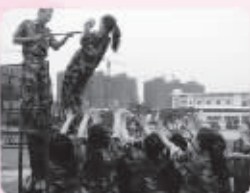
● 东方爱婴的老师们正在进行户外拓展训练