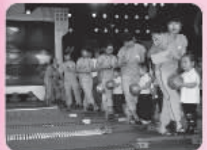
● 东方爱婴为0-3岁宝宝举行五项全能宝宝大赛,倡导宝宝五项能力全面发展的理念