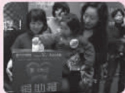
● 东方爱婴联合现代快报为脑瘫患儿募捐