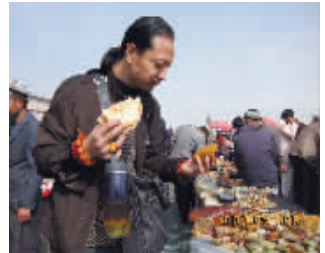
“怪老板”在新疆和田淘玉

玉石商见过不少,但鲜见这样的:爱玉如痴,100万淘来的和田仔料,有买主出3000万他愣是不肯卖。这位自称玉痴的“怪老板”,40多岁的男子,却有着过肩长发;衣着朴素,却佩戴价值连城的玉件。最近,“怪老板”在南京开了两家玉器店,囤积总价值超过3亿的和田仔料开卖。“我虽然卖玉,但不是谁想买我就卖!”他说,玉是看缘分的,希望有机会多跟南京的藏家交流。