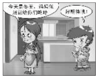
今天是冬至,妈妈做汤圆给你们吃哈!好期待哇!