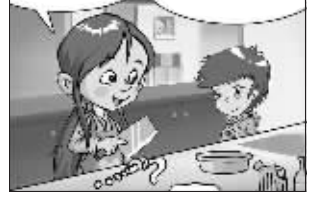
搓汤圆要放点盐,放点猪油,再放点用刀背拍扁了的生姜到汤里,还要放点蒜……