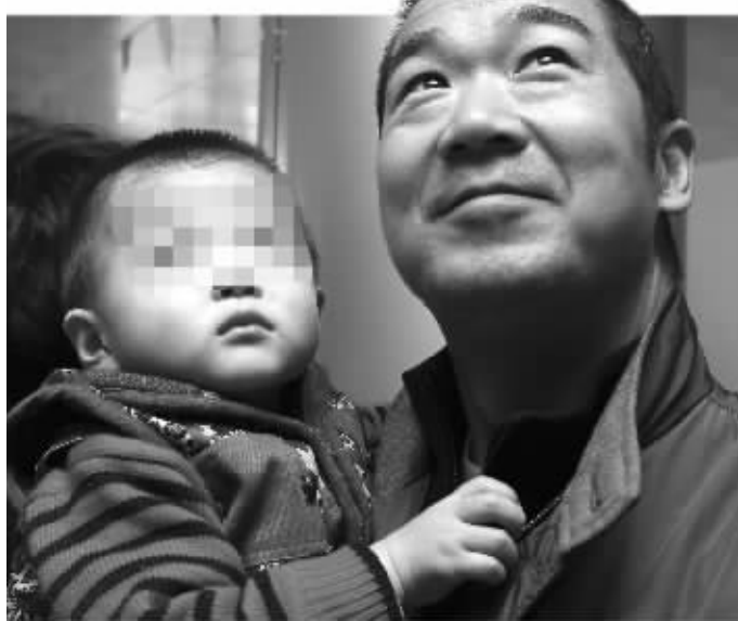
张国立抱着福利院的孩子

昨日，张国立带着《养父》剧里的一家人：老婆牛莉及三个“孩子”来宁，并特意来到南京儿童福利院。张国立说，此行的目的是为电视剧做宣传，但更希望看一看南京儿童福利院的孩子，给孩子们送来圣诞及新年的礼物：300本图书和300罐奶粉。据介绍，张国立的国立爱心基金还将承担该福利院两名患有先天性心脏病的孩子的全部手术费用。