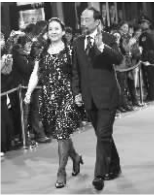
孙海英吕丽萍夫妇、孟非等明星登上红地毯