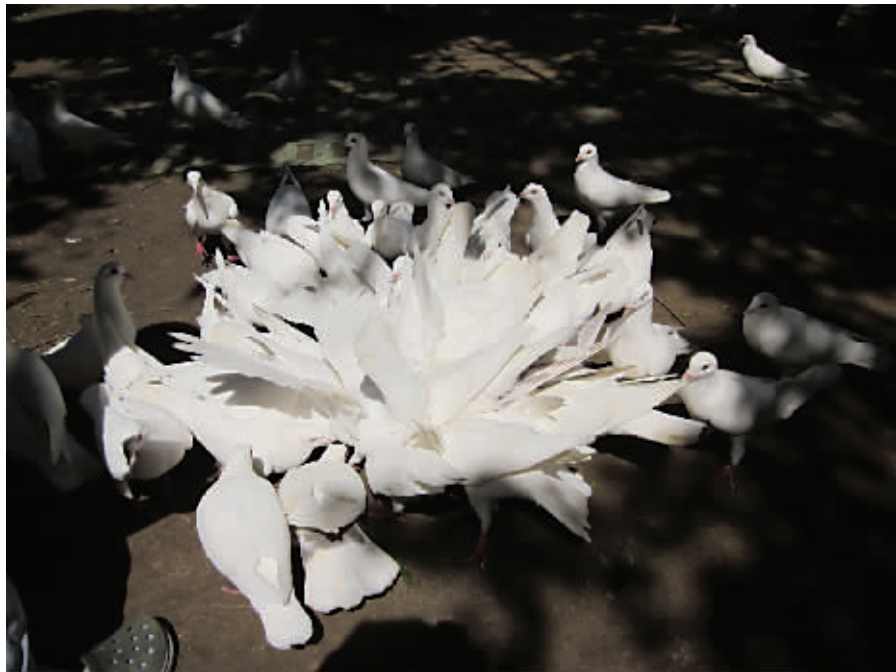
不要迷恋鸽,鸽只是传说……中那朵盛开的雪莲花。摄于中山植物园 (作者小虎妈获30元话费)