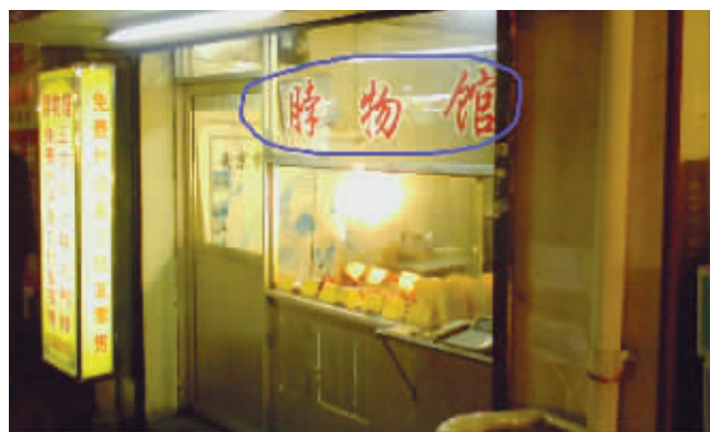
哥卖的不是鸭脖,是气势