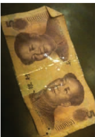
你还真不好说这是假钞