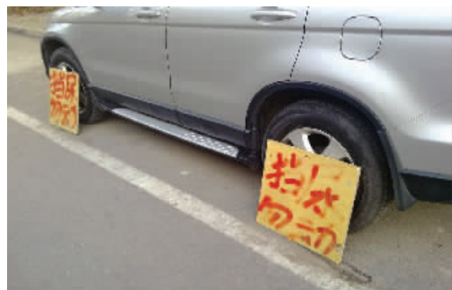
要想不被狗盯住,有车一族多种树啊