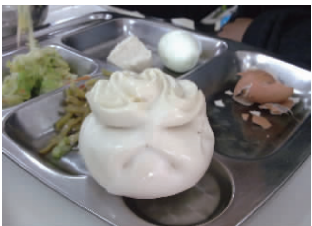
食堂面点师傅今天心情不好