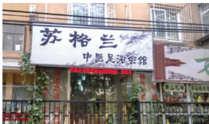
看你那名儿,这不是坑爹嘛