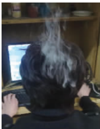
姐,您网瘾发作走火入魔呢