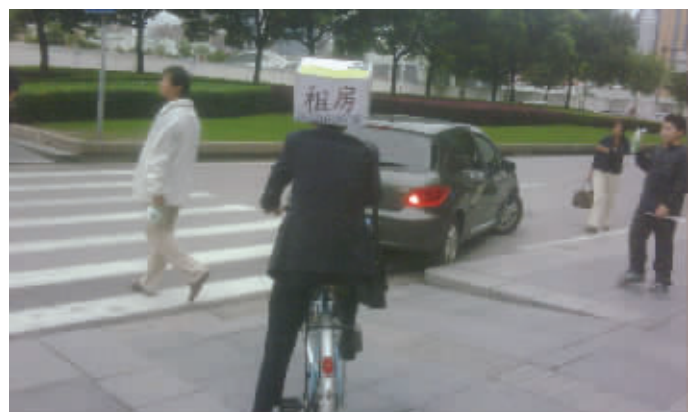
这哥们属于有车没房一族