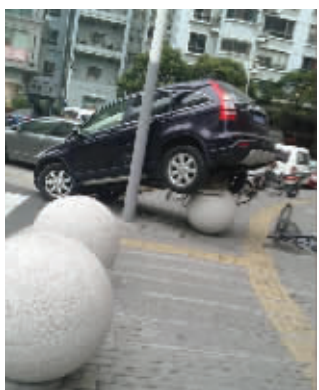
这造型,是想让屎壳郎给你代言嘛