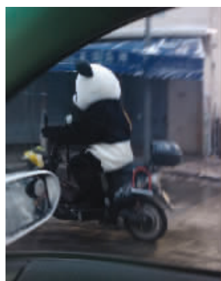
羽绒服out了,今冬流行熊猫服