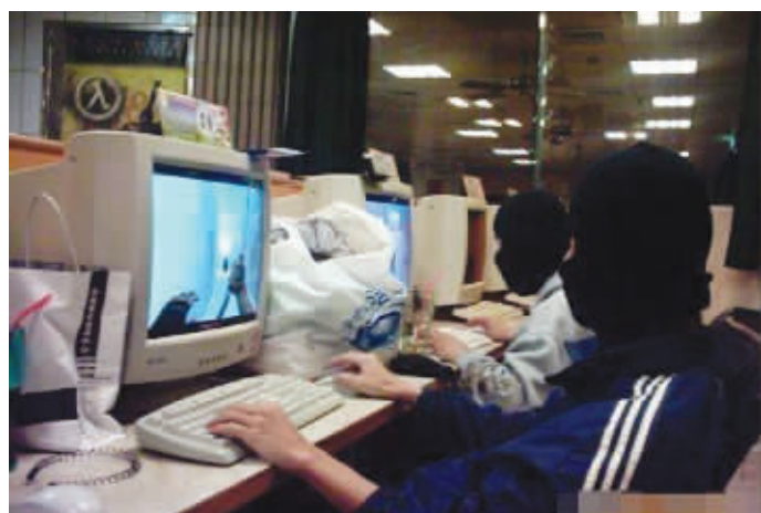
我们玩游戏的,最讲专业精神