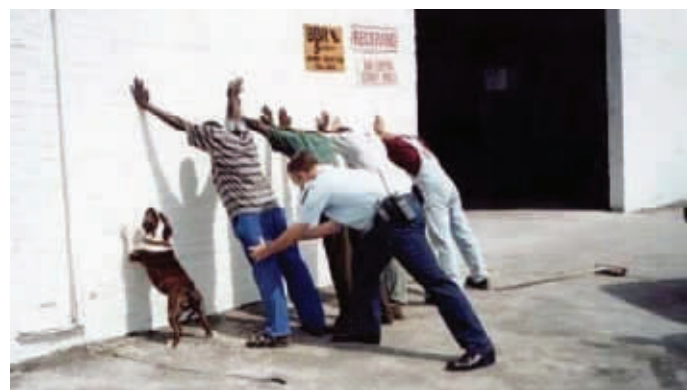
女怕嫁错郎,狗怕跟错人