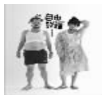
自由发挥 《自由发挥》 评分: ★★★★★