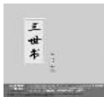
东山少爷 《三世书》 评分: ★★★★★