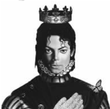
杰克逊 《Michael》 评分: ★★★★★

九年未发新歌专辑, 逝世已经一年半, 但杰克逊的传奇依旧在延续。永远的流行天王迈克尔·杰克逊(Michael Jackson)的最新同名大碟《Michael》于本月14日全球发行。无论这张专辑是出于什么目的推出, 都让MJ的粉丝义无反顾地继续追随。