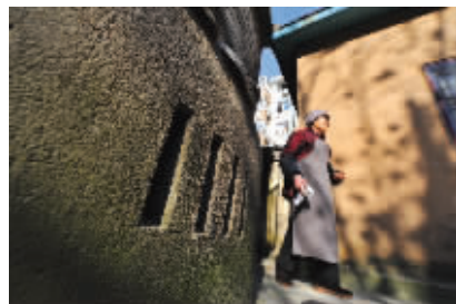
下沉的地下室有通风口