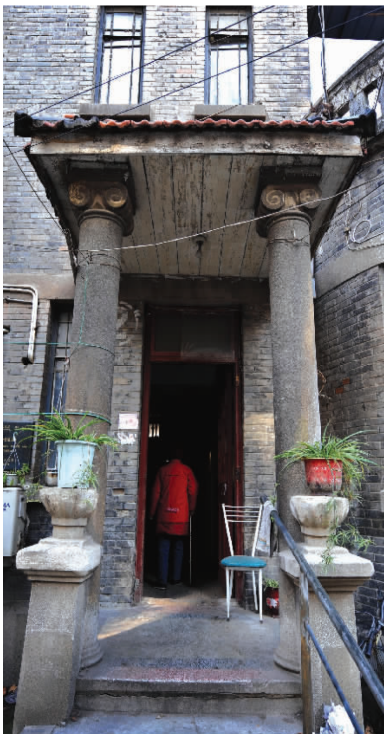
公馆现为居民用房

1949年3月,张笃伦出任西南长官公署西南政务委员会委员兼秘书长,又回到了重庆。是年11月底,刘邓大军挥师入川,张笃伦随国民政府迁往台湾,1958年2月去世,时年66岁。