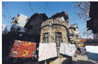
屋前晾晒着被子,充满生活气息