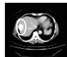
服用基英肽治疗前 肝部肿块约有7cm

一周后,食欲和睡眠均有改善,白细胞升至4200;20天后,肝区疼痛减轻,腹水逐渐被吸收,腹部饱胀感基本消失,服用一个月后复查:肝部