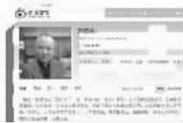
郭德纲“道歉微博”截图

如果孩子因此毁了一生,我会内疚一生的。可见,艺人不能轻视自己,正确引导很重要。这十余年,全社会对我很宽容,无数的观众支持我走到今天,众多媒体也是功不可没。我承认,八月份伤害了很多人。人不错成仙,马不错成龙,知错要改!向全社会及观众、媒体、北京台致歉!我要反思。