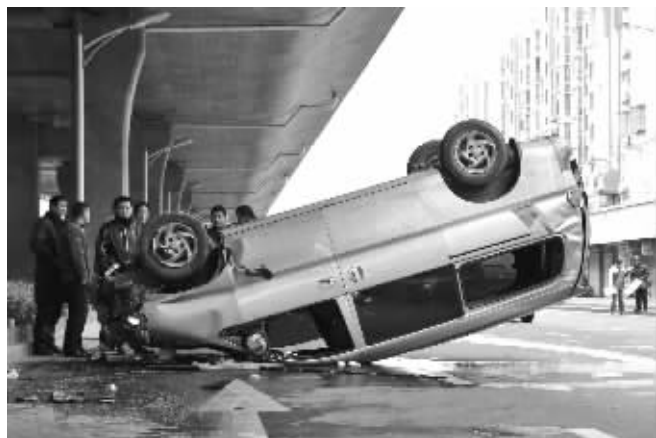
翻车后,路上的活鱼很快被拾起运走

昨天上午9点20分左右,在应天大街康美里小区门口,突然传来“哐、哐、哐”三声巨响,只见一辆银灰色现代商务车在快车道上连续撞击,最后翻了个底朝天,几百条鲫鱼从车里哗啦啦流出,涌到快车道上,所幸驾驶员无恙。