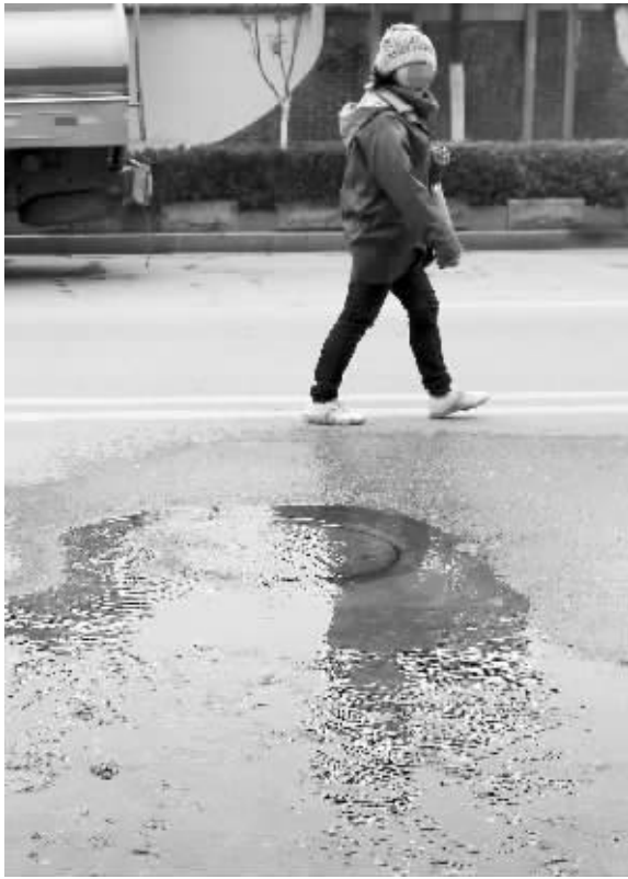
污水不断从窨井里冒出