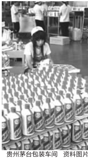
贵州茅台包装车间 资料图片

今年下半年以来,随着原辅材料价格的上涨,已有白酒类上市公司上调产品出厂价格。洋河股份10月间公告,自10月15日起适当上调公司“蓝色经典·天之蓝”系列产品的出厂价格,平均上调幅度约为5%。不过,五粮液高层日前对涨价传闻作出回应,称近期并没有提高出厂价的打算。但根据机构的调研数据看,茅台、五粮液等几种名酒出厂价和批发价之间的差距达到了150元至400元。从维护股东利益和压缩经销商暴利的角度看,上市公司似乎有着充足的调价空间。如今,白酒龙头贵州茅台已经宣布上调产品出厂价,是否引得其他白酒生产企业效仿,尚待观察。 快报记者 魏梦杰