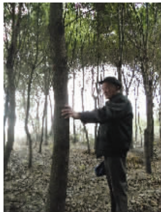
老人抚摸着亲手和老伴栽培的香樟树,流露出不舍