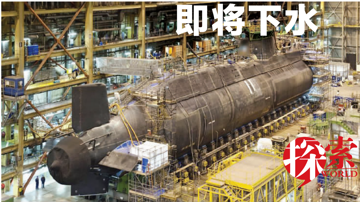
英国最大核潜艇“伏击号”

英国最大的核潜艇,造价12亿英镑的“伏击号”即将于16日下水。这艘最新的核潜艇使用的核反应堆足以为南安普顿这样的城市提供能量,在未来25年服役期间,它永远不需要补充燃料,并能用先进的导弹击中1600公里外的目标。这艘“超级潜艇”还能从海水中提取氧气和淡水,足够98名船员度过危机。