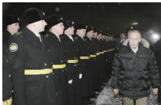
俄总理普京视察船厂

俄罗斯总理普京12月13日表示,未来10年内俄罗斯政府将拨款20万亿卢布(约合6460亿美元)用于采购军备和进行武器研发,以打造一支现代化的新型军队,其中重点要加强战略核力量建设。