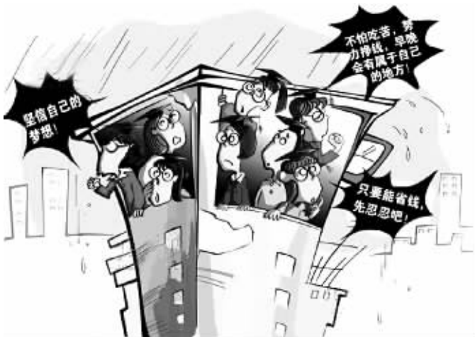
安居乐业的青春梦想如何飞扬

日常用品方面,她花销是40元/月,一般不化妆,甚至用淘米水自制面膜保养,还自得其乐地说,“想怎么做就怎么做。”按理