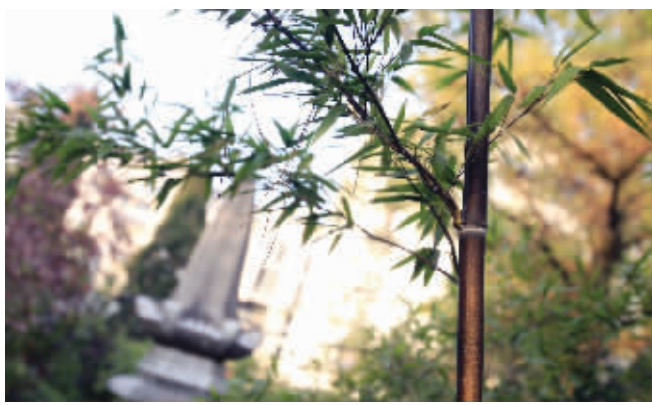
这里还保存着一片美丽的紫竹林

“其实这个地方真的有一片紫竹林。”厉金诸老人退休前曾是一名医生,他常到这里,所以他知道,这里还保存着一片紫竹林。按照他指点的方位,记者来到南京市疾控中心,找到了紫竹林。这