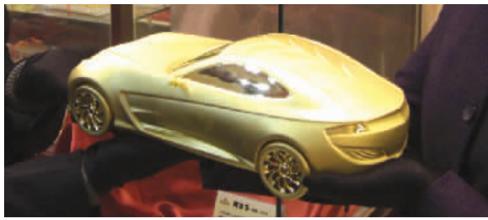
宝庆银楼的一辆黄金跑车,重5公斤。

每年年底是黄金的销售旺季,尤其是投资金条。但今年和往年有所不同,今年南京人的购金需求特别旺盛,因此投资金条也开始了一场投资者争夺战。记者日前从南京市场上了解到,虽然金价屡创新高,但有些品牌投资金条从上周末开始仅在金交所现货金价基础上加10元,金饰品价格则直降20元/克。