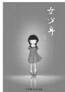
2010年11月 中国戏剧出版社 秋微著

作者以幽默的笔调和温暖的语态回顾了上世纪80年代的一个小城市中的典型家庭故事。这个四口之家是那个时代具有代表性的家庭组合。从70年到85年出生的人群都能在这部小说中找到自己过往生活的影子和心路的变化。