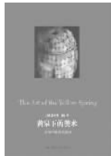
2010年12月 三联书店 巫鸿著

作者从空间性、物质性、时间性三个比较观念性的角度,阐释了中国墓葬艺术从史前一直到宋辽金漫长时段中的历史变迁,生动展示出中国古人对于“生”与“死”这一人生基本问题的看法和实践,对读者多有启发,对研究者也有一定的借鉴意义。