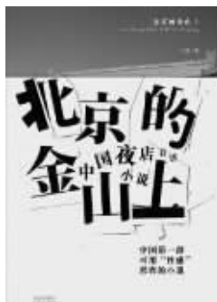
《北京的金山上》 大仙著 凤凰出版社 2010年11月

认识大仙是在十五年前北京一个记不起名字的街头小饭馆里,他当时是诗人,同时也是我的文学前辈。他在北青报当体育记者,深夜醉酒之后打车回家,付不出车费,便拿记者证在出租车司机眼前乱晃。那记者证还用来在常去的小饭馆赊账,因为喝高兴了,即使朋友们把钱包里所有的钱都拿出来,仍凑不出几瓶燕京啤酒钱。不知道那时的大仙是如何在清醒之后借到钱,一个人默默去饭馆还账的——看完《北京的金山上》,我相信当时的大仙也许是哼着歌曲去的,没有农民式的抱怨,他只是在为