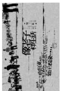
《像老子一样生活》 海飞著 中国时代经济出版社 2010年12月

你对“像老子一样生活”这样的题目望而生畏了吗?如果你鼓起勇气看完这本书,你会大吃一惊,继而微笑点头。其实这题目是有歧义的,面对一本精美装帧的书,我们总是下意识把这个“老子”理解为骑着青牛出关的老头,而事实上,这只是平凡市民最常出现的粗口而已。所以说,这不是一部讲述老子“道可道非常道”的理论性文章,也不是高高在上教导我们如何“顺其自然”生活的指导方针——这只