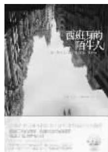
2010年12月 中国友谊出版公司 熙弦著