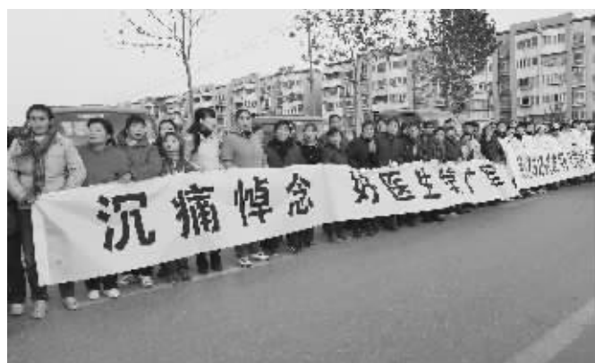
数千人来送续广军最后一程

“我打算把哥哥接回家安葬后,就把父母接到身边来照顾。”续广军突然离世,让弟弟长大了很多。他告诉记者,“今后的两年,我准备先把工作稳定下来,也让爸爸妈妈的情绪稳定下来,