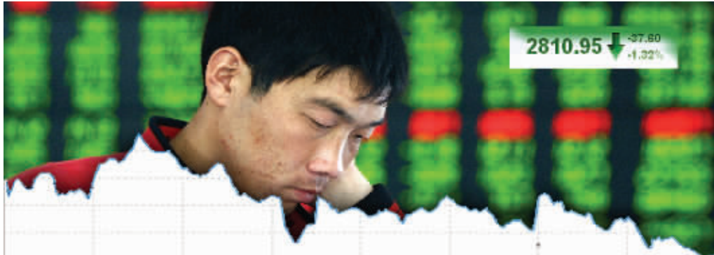
昨日大盘震荡走低 制图 李荣荣

正当多头沉浸在收复年线的喜悦中时,连续两日的调整,又给了他们当头一棒。在加息传言再度来袭的背景下,昨日大盘几乎以全天最低点收盘,并逼近2800点。盘面热点上,除了受政策利好带动的高铁概念股外,其余题材和蓝筹权重股均走弱。业内人士表示,投资者都在等待政策明朗,谨慎心态明显。尽管如此,市场也有闪光点,一些个股盘中快速拉升,显示有资金正在建仓。