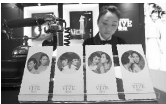
今年8月,上海家化推出了拥有百年历史的双妹品牌 资料图片

又一只重组股停牌,有望上演双汇发展6连板的神话!近日,上海家化(600315)公布控股股东上海家化家团有限公司(下称“家化集团”)重组的公告,股票也自12月6日开始停牌。而对于这次重大重组,机构看好公司后市股价,但有部分散户因为没有“耐得住寂寞”而被“洗出局”。值得注意的是,就在公布这则重大利好之前,上海家化的大股东也竟然提前减持,在二级市场上马失前蹄。