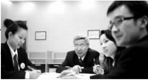
学大专家团队为学生定制个性化辅导方案