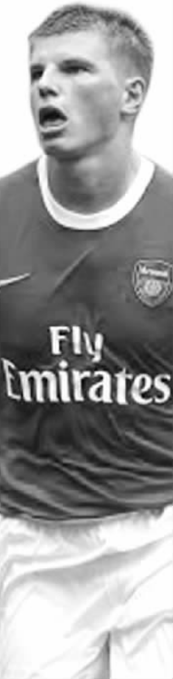
帮助俄罗斯申办世界杯成功的阿尔沙文能把好运带给阿森纳吗?