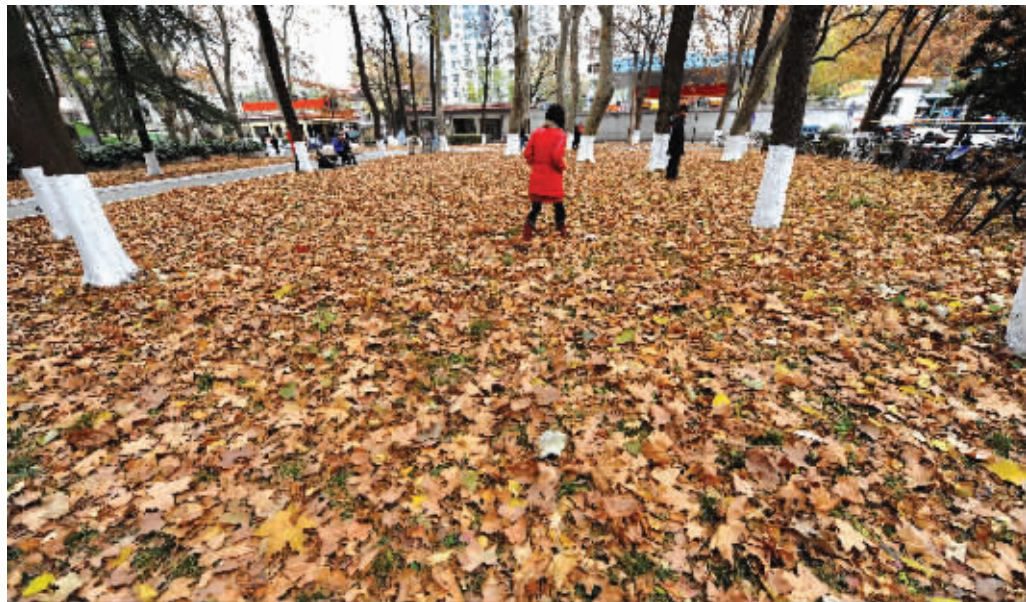
昨天,南京一校园内落叶满地。今天是大雪节气,风用它特有的语言告诉人们:秋去冬来了。