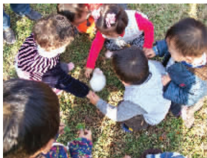
小时候,我们是围观者,被围观的小白兔表示鸭梨很大! 摄于莫愁湖公园 (作者 鲍加 获30元话费)