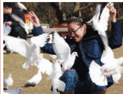
小白兔,长大后我就成了你,才知道被围观的鸭梨:姐有点招架不住啊! 摄于音乐台