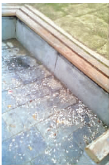
随身带个小塑料袋,边吃边扔进袋再丢进垃圾桶里,真就那么费劲? 12月5日下午摄于玄武湖