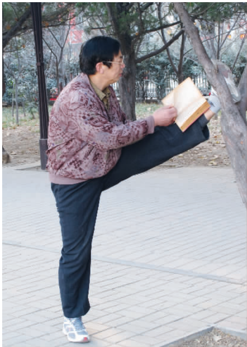
锻炼,是为“修身”;读书,是为“养性”。修身、养性,向前一步到位,您真是高人啊! (作者 焯子 获30元话费)