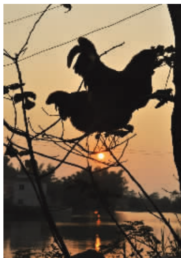
想让鸡下金蛋,天时(傍晚)、地利(树上)、人和(选角度)缺一不可! 摄于上林白圩 (作者 陆叶 获30元话费)