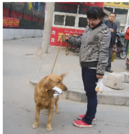
狗拿耗子,多管闲事。这狗拿报纸,就明显有所图了:哇,诱人的早饭! (作者 西流湖 获30元话费)