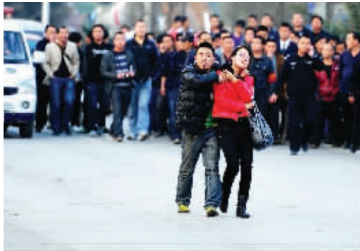
劫持人质并保持行走状态