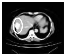
服用基英肽治疗前 肝部肿块约有7cm

一周后,食欲和睡眠均有改善,白细胞升至4200;20天后,肝区疼痛减轻,腹水逐渐被吸收,腹部饱胀感基本消失;服用一个月后复查:肝部