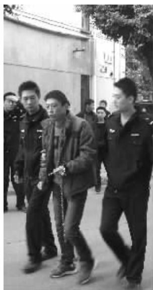
昨天下午,嫌疑人指认现场