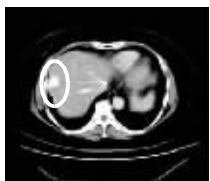
服用基英肽生物疗法后肿块缩小至2cm

肿块缩小至5cm,气色不错。结合介入治疗2个疗程,没有副作用出现,肝部肿瘤已缩小至2cm。七、八年过去了,未出现转移和复发,随着老李身体的康复,老伴的身体也随之一好转。