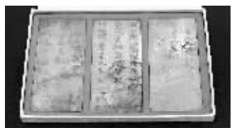
43件套南唐二陵宝贝昨在江宁展出，其中尤为珍贵的是当年从烈祖李昇墓出土的“玉哀册”。

以古代天子之宝善龙钮，乾隆八徵之宝双龙钮为原型，用重达 5.5 公斤和田青玉手工雕琢的“传世福寿双玺”，堪称世界之最！