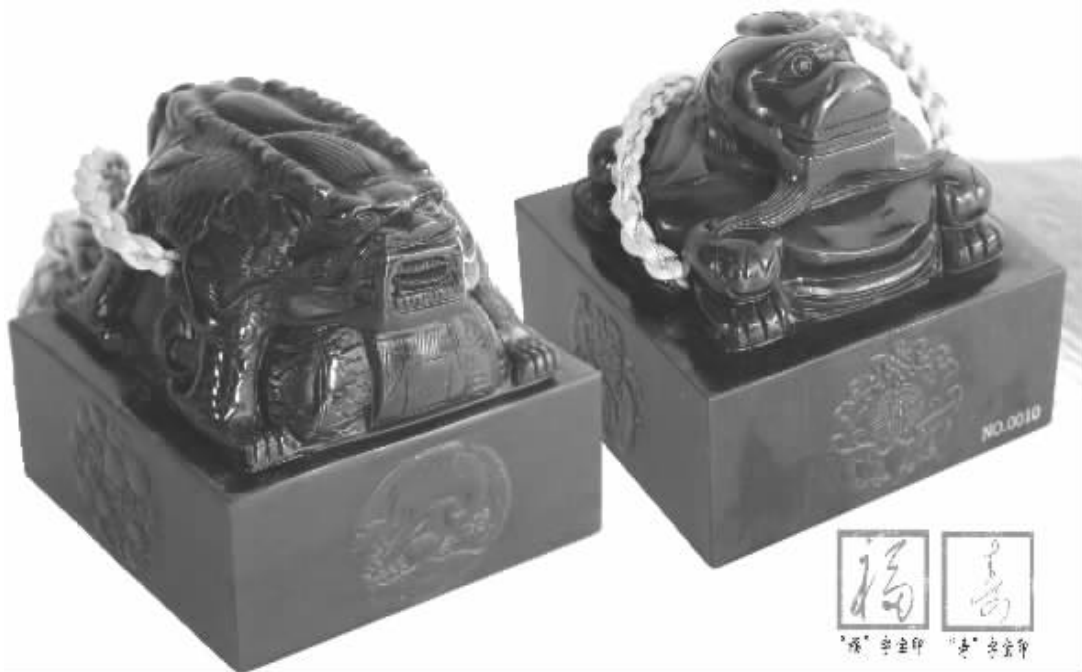
【国宝档案】双玺重达 5.5 公斤，玺基规格 11cm×11cm×11cm，印文是毛体的“福”字；寿玺基四周浮雕寿桃、仙鹤、神龟、千寿图，寓意龟鹤同寿、福祿双全，印文是毛体的“寿”字；“福寿双玺”巧妙组合，巧夺天工，光耀王者风范！

近年来，玺类藏品一直领涨海内外收藏市场，屡创拍卖新纪录！2008 年 10 月，乾隆帝御宝交龙钮《乾隆御笔》白玉玺在香港苏富比秋季拍卖会上以 6338 万港元成交，今年 6 月 26 日，“乾隆青玉螭龙玉玺”在