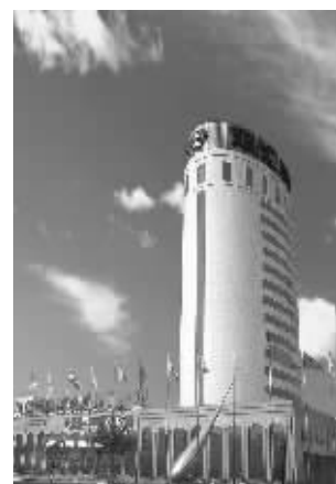
双汇集团 资料图片

“我们选择买入就是抱有重组预期的。”上海某基金人士向记者透露,“但当时并没有料到双汇发展会停牌这么长时间。”11月29日,停牌8个多月后,双汇发展终于发出复牌公告。当日就有4家机构出具研究报告称,在复牌后的半年时间内,该股票的预测目标价位锁定在90元至100元区间。